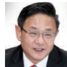
최병환 CJ CGV 대표이사 40기

KAIST AIM에는 새로운 흐름을 예측하는 감각과 새로운 변화에 대응하는 유연성, 새로운 바람을 일으킬 수 있는 전략이 있습니다.