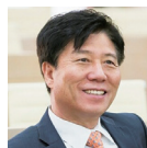
김태호 서울교통공사 사장 48기

꿈, 미래, 희망에 대한 충격을 원하고, 변화와 혁신에 대한 갈증이 있다면 카이스트 AIM로 오십시오. 카이스트 AIM의 최고수준의 혁신적인 강의와 인적네트워크가 곧 꿈이고 미래이고 희망이었습니다.