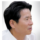
허상구 대전지방경찰청 홍성지청장 39기

4차 산업혁명과 디지털화의 흐름 속에서 기업의 미래 비전을 고민하는 최고경영자들이 새로운 지식에 대한 갈증을 해소하고 업에 대한 통찰력을 얻을 수 있는 차별화된 기회입니다. 서로의 경험과 고민을 공유하는 가운데 평생친구의 인연으로 탄탄한 네트워크를 형성할 수 있습니다.