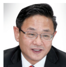
최병환 CJ 4DPLEX 대표이사 40기

세상을 살다 보면 무엇을 어떻게 해야 좋을지 전혀 감조차 잡을 수 없이 막힐 때가 있습니다. 무엇인가 변화해야 하는데 그 길을 알 수 없는 경우 말입니다. KAIST AIM 과정에서 자신을 바꾸어 보시지 않으렵니까? 제가 그랬듯이 자신의 문제는 혼자서 풀기는 어려우니까요.