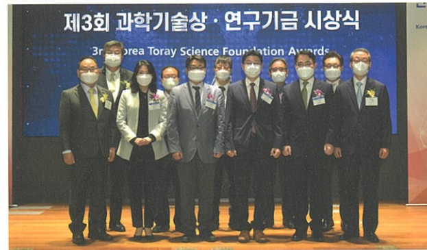
한국도레이과학진흥재단 Korea Toray Science Foundation은 2018년 1월 과학기술정보통신부로부터 인가받은 공익재단입니다.